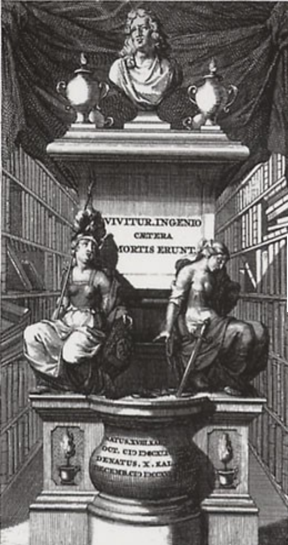
Frontispice du catalogue de vente de la collection du savant Gisbertus Cupe

Objets vendus en dehors des manuscrits et des imprimés : Estampes, cartes.