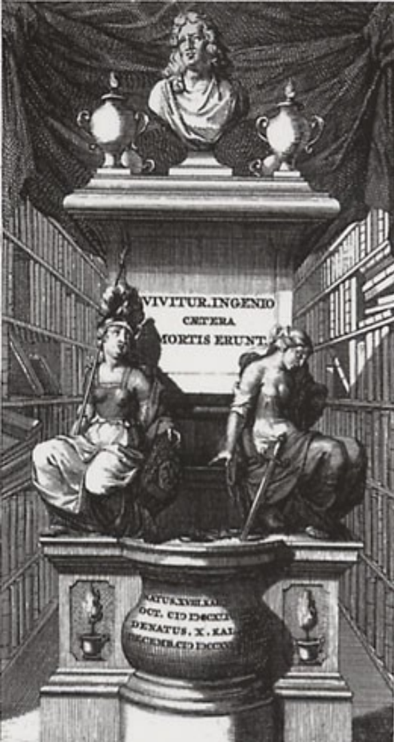
Frontispice du catalogue de vente de la collection du savant Gisbertus Cupe

Justificatif de l'estimation : Prix indiqué dans la table des prix de vente trouvée à la fin de l'exemplaire Collect. I/LAVA 1 de la Réserve de la BnF ainsi que par un ajout mss dans le même exemplaire.